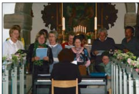
Det var dejligt at høre voksenkoret synge ved sognedagens gudstjeneste.