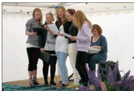
Det Rytmske Ungdomskor sang ved gudstjenesten til Sportsfesten i Sundby.