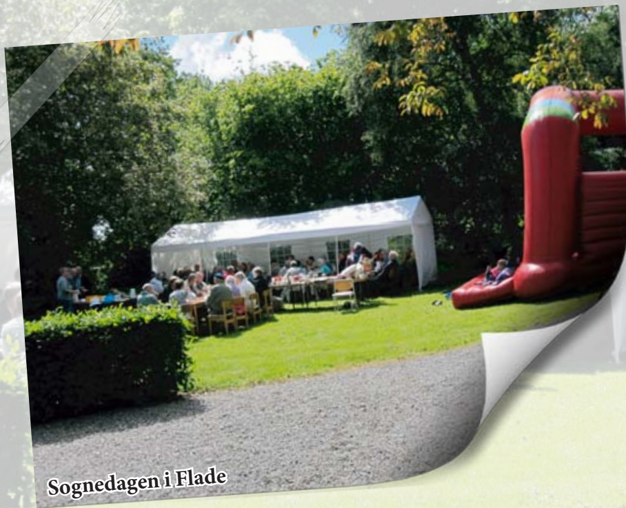
Sogndagen i Flade