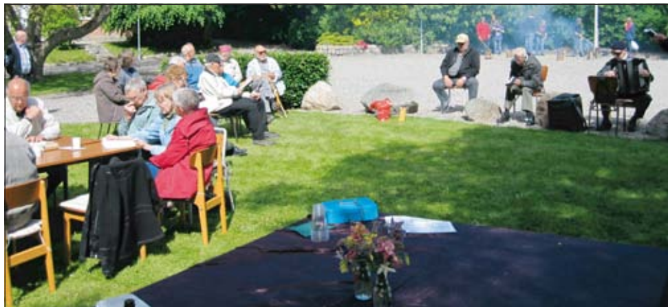
Sognedagen i Flade blev en dejlig dag – med fællesskab og mange mennesker, der gjorde en stor indsats.

I juni mødtes vi til sognedag i Flade, Sportsfest i Sundby og til en sommersangsgudstjeneste i Bjergby. Både i Flade og Sundby sang et af pastoratets nye kor, og i Bjergby var der også sang og fællesskab.