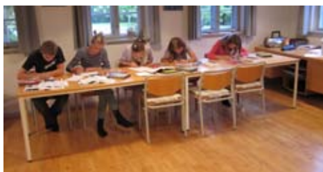
Årets (meget lille) konfirmandhold arbejder flittigt.