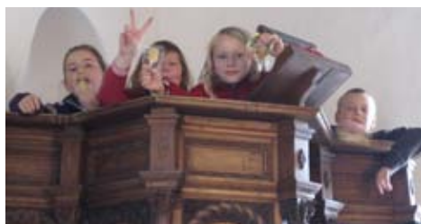
Minikonfirmanderne på opdagelse i kirken...