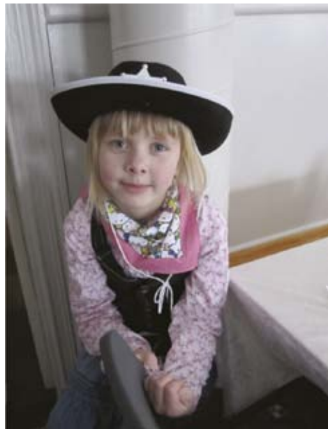
Lea til fastelavnsfesten 2010

Mød udklædte op i kirken til fastelavngudstjeneste. Og slå bagefter katten af tønden i Sundby Forsamlingshus. Igen i år er Idrætsforeningen og Sundby Kirke gået sammen om et festligt arrangement!