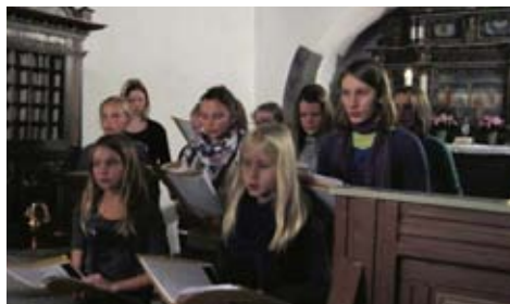
Bjergby Friskoles kor sang også i kirken i december. Nu glæder vi os til at høre dem igen!

Påsken nærmer sig, og denne aften vil vi traditionen tro høre tekster fra Bibelen og nyde sangen – både når vi synger sammen, og når vi lytter til koret. Alle er velkomne – både børnenes familier og alle andre. Efter gudstjenesten er der kaffe/sodavand og bagværk i kirken.