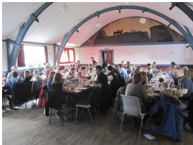
Fællesspisning efter børne- gudstjenesten før Påske. Der var deltagere fra alle de tre "gamle" sogne.