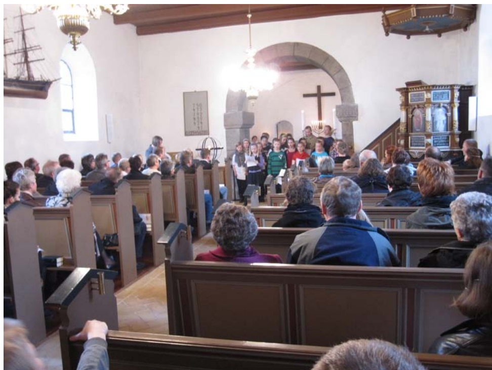
Sundby Friskoles kor sang i kirken en søndag i april. Tak for den smukke sang!